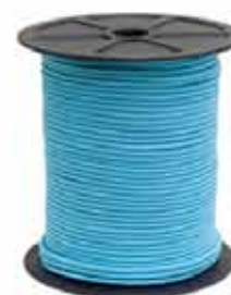
09 - Azul Turquesa