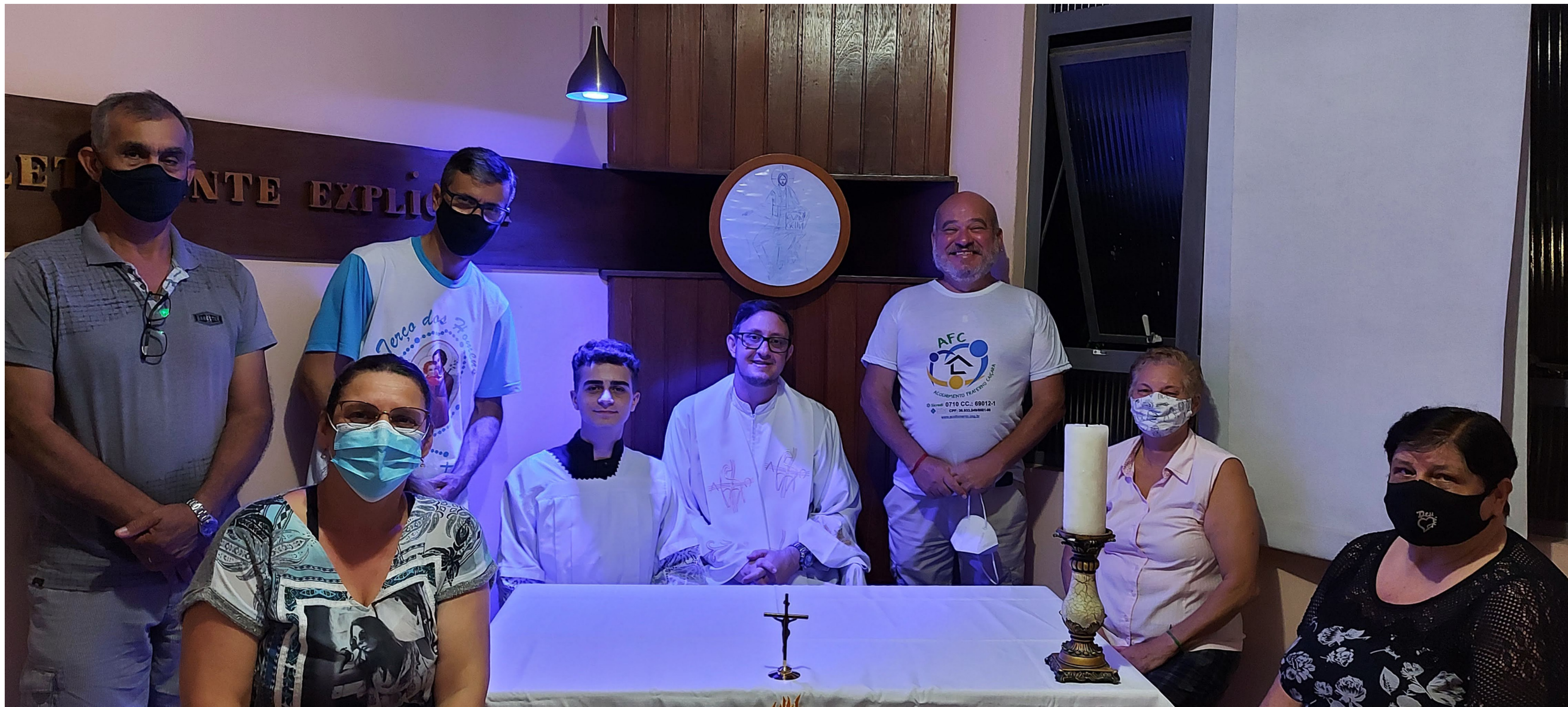
1º missa na Capela São Pelegrino 14/02/22