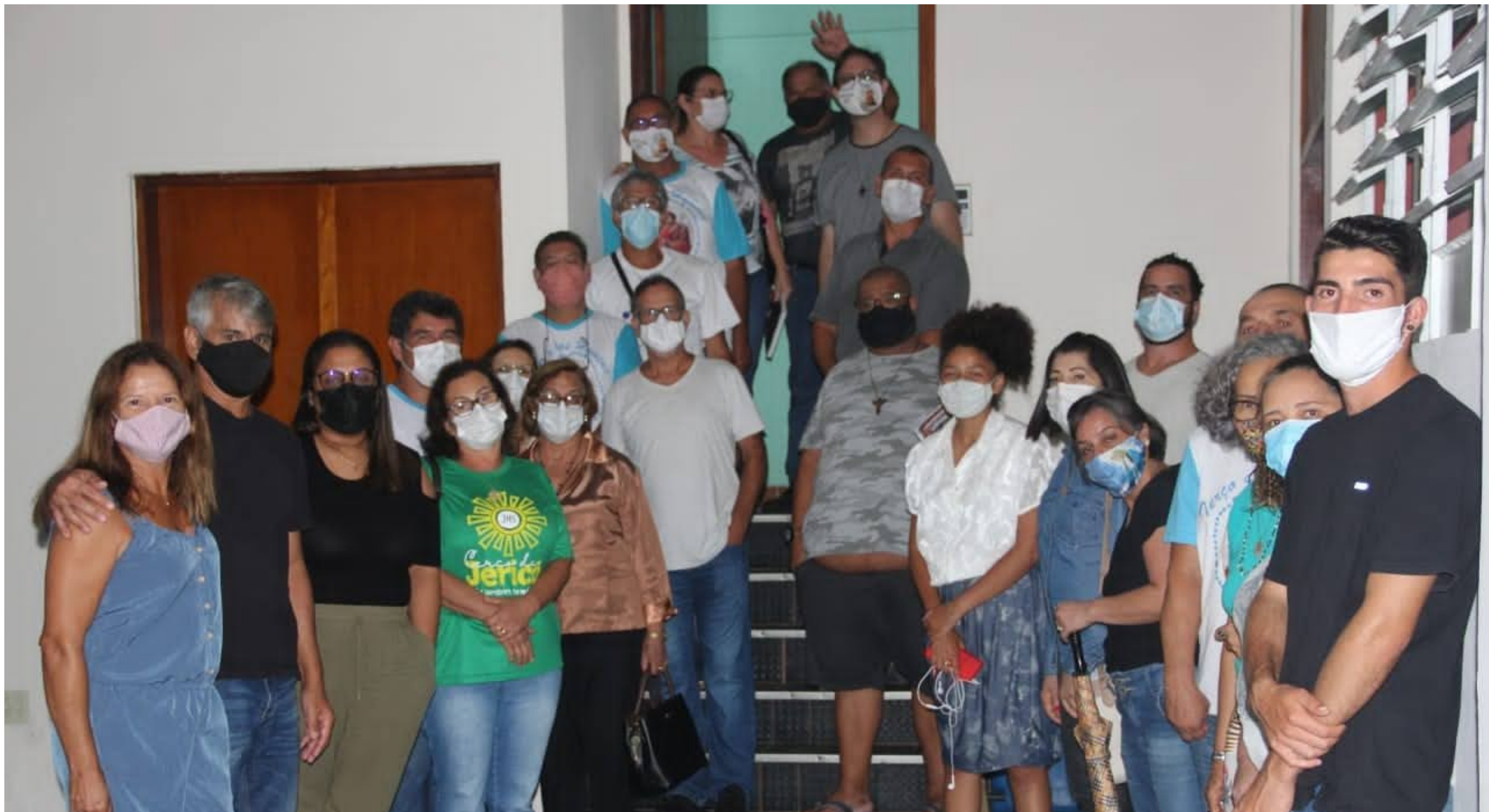
Reunião com Voluntários na Catedral 11/01/22